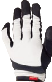
1 ホワイト / ブラック (WK)