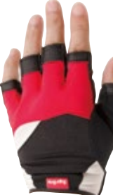
2 レッド / ブラック (RK)