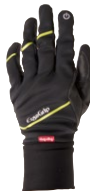
1 ブラック / イエロー (KY)