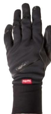
2 ブラック / ブラック (KK)