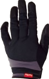
2 ブラック / グレイ (KG)

①ドロップハンドルをもつ場合 ②ブラケットをもつ場合 ③Tバー (MTB クロスバイク)でのクルーシングの場合。実際の接地面とパッドの位置関係の比較。