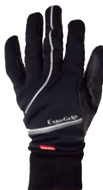
1 ブラック / ブラック (KK)