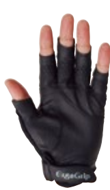
1 ホワイト / ブラック (WK)