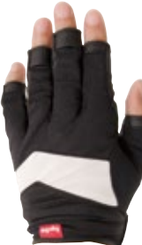
2 ブラック / ホワイト (KW)