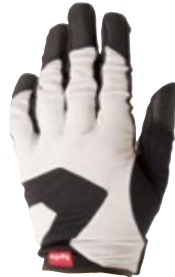
1 ホワイト / ブラック (WK)