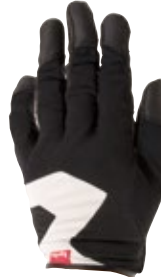
2 ブラック / ホワイト (KW)