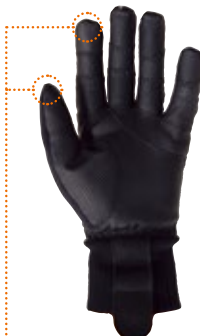
タッチパネル・スマホ対応素材を使用

ウィンターシーズン対応の全指タイプ 品番: U194 サイズ: XS、S、M、L、XL