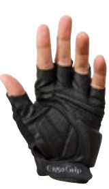
1 グレイ / ブラック (GK)