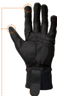
タッチパネル・スマホ対応素材を使用

ウィンターシーズン対応の全指タイプ 品番: U184 サイズ: XS、S、M、L、XL