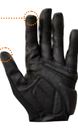
タッチパネル・スマホ対応素材を使用

オールシーズン対応の全指タイプ 品番 : U183 サイズ : S、M、L、XL