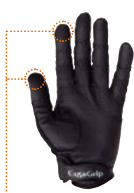
タッチパネル・スマホ対応素材を使用

オールシーズン対応の全指タイプ 品番 : U193 サイズ : S、M、L、XL