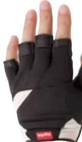
3 ブラック / ブラック (KK)