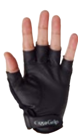
1 ホワイト / ブラック (WK)